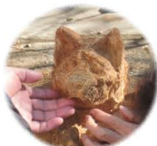
写真が不明瞭ですが、犬です

ドの方が不在で説明してもらえませんでした。が参加者の人の案内で少しわかりました。皆さん「楽しかった。ありがとう、また何処かへ行こう」と。後日お礼の気持ちと言って増資してくれた方がみえました。